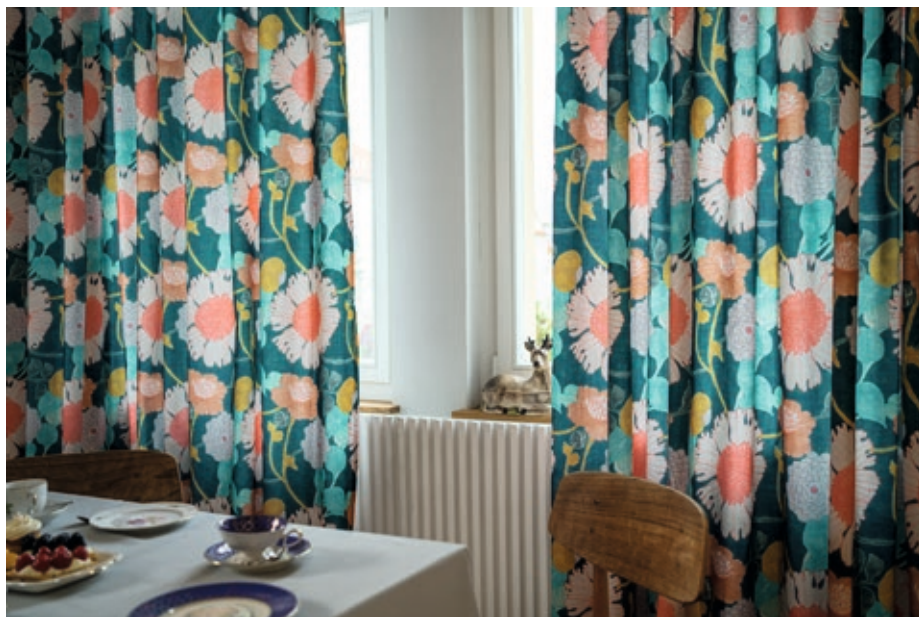
Floraler Druck, raumhoch, Beschwerungsband, Warenbreite: 280 cm, 4 Kolorits, 100 % PES

FLANEUR – die Momentaufnahme eines Gartenidylls. Florales Design und frische Farben laden dich zum Flanieren durch die eigenen vier Wände ein. Genieße das moderne Ambiente in blumigem Aqua/Lobster auf markant dunklem Petrol-Fond, Orange/Blau auf faszinierendem Salbeigrün, Türkis/Terra auf elegantem Silbergrau oder Grün/Gelb auf puristisch weißem Fond.