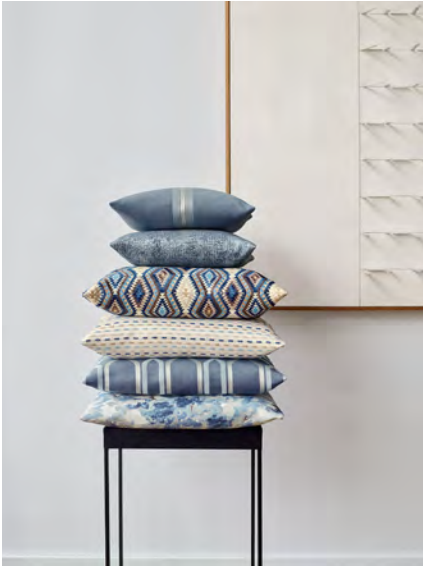
Kissen - von oben nach unten Odea 1211, Toto 1214, Asset 1210, Effect 1215, Cone 1212, Smith 1213